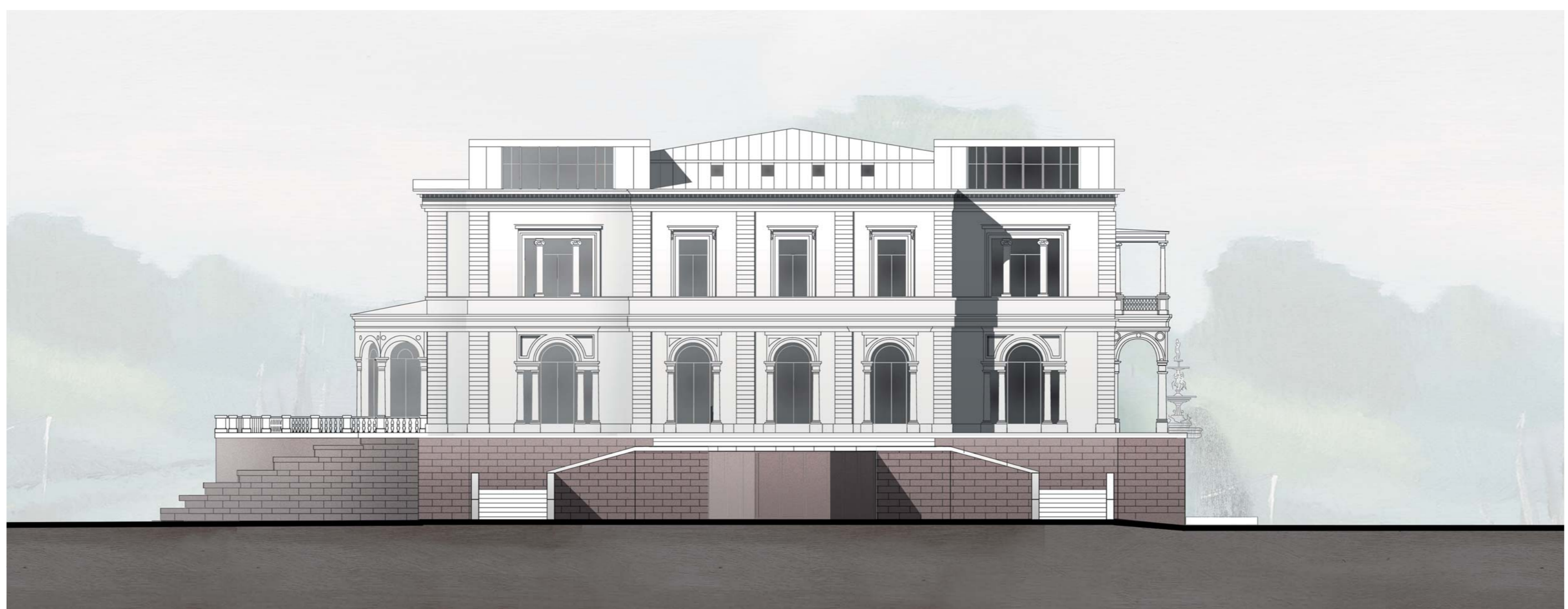
Ansicht Süd 1:200

im sogenannten 'Olga-Album' sind zahlreiche Aquarelle erhalten, welche die Innenräume der Villa darstellen. Der zweigeschossige Ballsaal mit zwei Emporen war der grösste Raum der Villa. Er zeigt die besonderen Qualitäten des Innenausbau, der Möblierung und der Dekoration. Im Entwurf wurde versucht den ursprünglichen Innenraum zu analysieren um die Haupteigenschaften wiederzugeben.