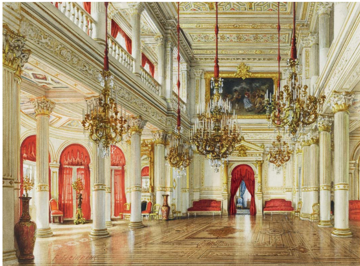
Franz Heinrich, "Salle de bal à la grande Villa Berg", 1855