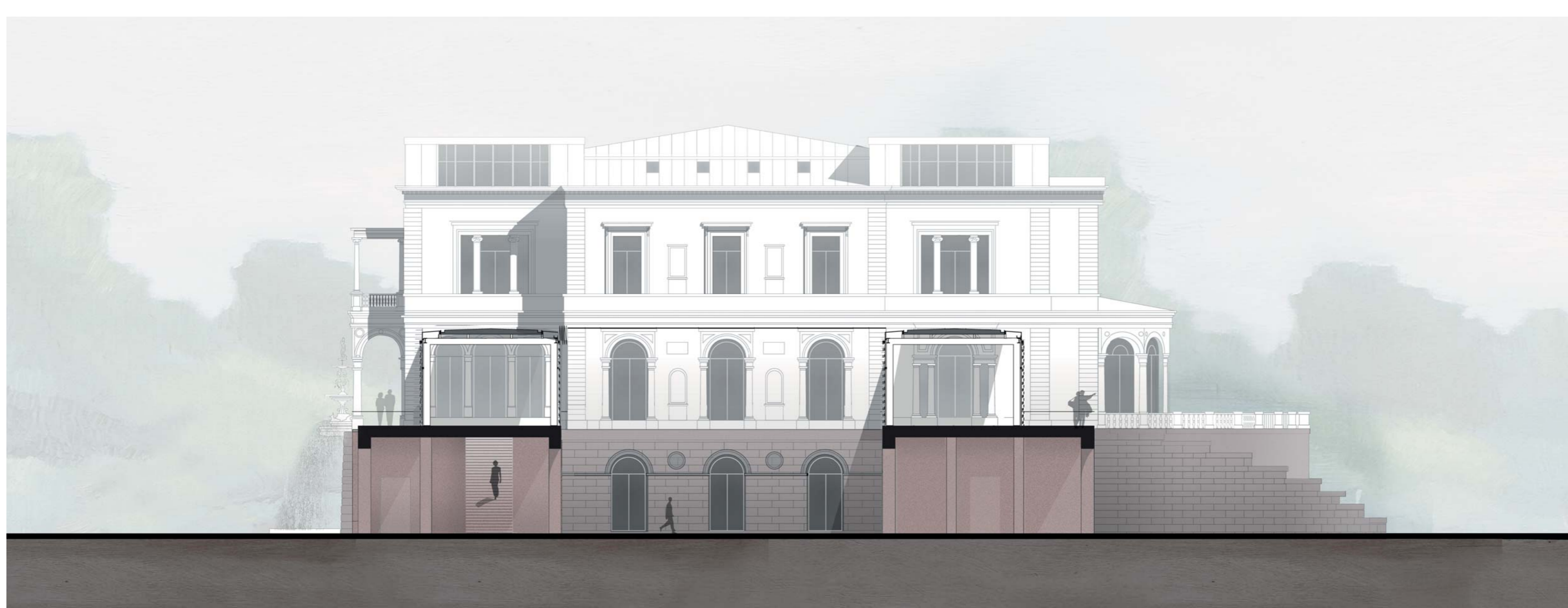
Schnitt D-D 1:200