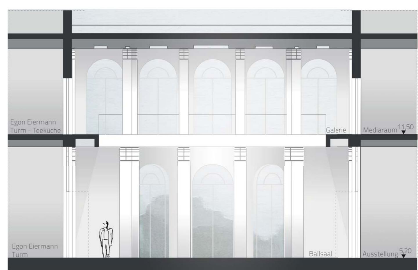
Ballsaal Schnitt 1:100